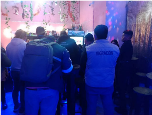
Foto: Subdirección de Atención y Protección, apoyo a migrantes en retornos voluntarios.

Se dio acompañamiento a 65 retornos voluntarios y 6 repatriaciones en cumplimiento con las resoluciones emitidas por la Subdirección de Control Migratorio, así también se proporcionó acompañamiento en los procesos de repatriación de niños, niñas y adolescentes no acompañados o separados de su familia, víctimas de trata de personas o explotación sexual o laboral, personas vulnerables y los casos de retorno voluntario, solicitados por los consulados acreditados en Guatemala.