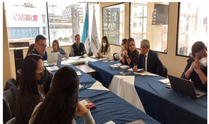
Reunión con Interpol.

Se participó en la Mesa Técnica para el seguimiento del convenio de cooperación existente entre el IGM-Interpol, para el intercambio de información en temas de seguridad migratoria, actividad realizada con personeros de Interpol Guatemala y el Instituto Guatemalteco de Migración.