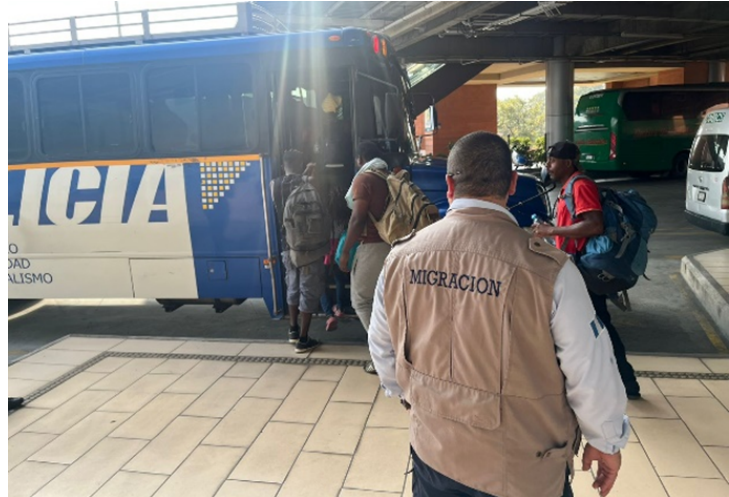
operativo de control migratorio en Centra Norte.

Se llevó a cabo un operativo conjunto para establecer la situación migratoria de personas extranjeras, que transitaban en la terminal de buses Centra Norte de la ciudad de Guatemala, actividad en donde se logró localizar a 44 personas que se encontraban de manera irregular en el país, los cuales fueron remitidos para solventar su situación migratoria.