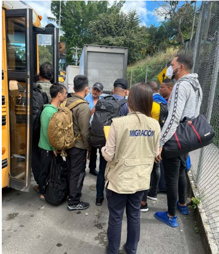
Foto: Operativo de Control Migratorio.

Se solventó la situación migratoria de 220 personas extranjeras (solicitud de carencia de arraigos, solicitud de movimientos migratorios, órdenes de expulsión), la repatriación de 03 menores de edad por orden judicial, así como el retorno voluntario de 45 personas hacia su país de origen, emanando resoluciones para hacer efectivas las disposiciones de la Subdirección de Control Migratorio y Juzgados de la República.