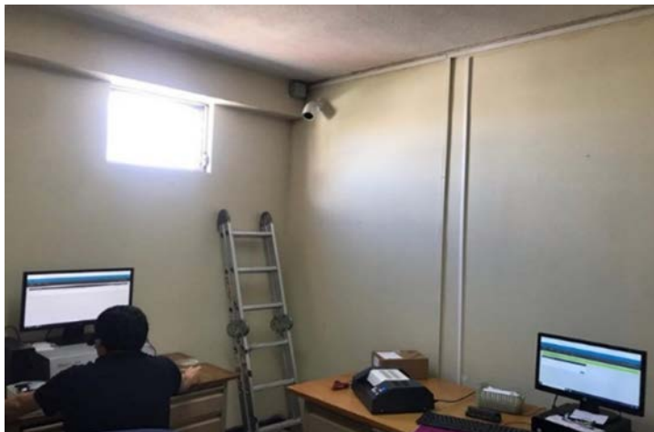
instalación de cámaras de seguridad.

El Departamento de Adquisiciones, realizó la publicación de la Licitación Pública Nacional No. IGM-IC-2023, de Adquisición de Libretas para Pasaportes Ordinarios Guatemaltecos para el IGM, con el fin de abastecer la Unidad de Pasaportes.