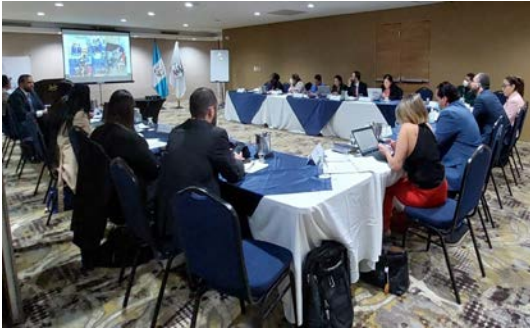
Foto: Reunión ordinaria del Consejo de Atención y Protección (CAP).

Se dio acompañamiento al cumplimiento de 203 procedimientos de expulsión de migrantes que infringieron el Código de Migración y los acuerdos de la Autoridad Migratoria Nacional, así también se acompañó, a los diferentes puestos migratorios autorizados, para que sean remitidos a su país de origen o país de procedencia.